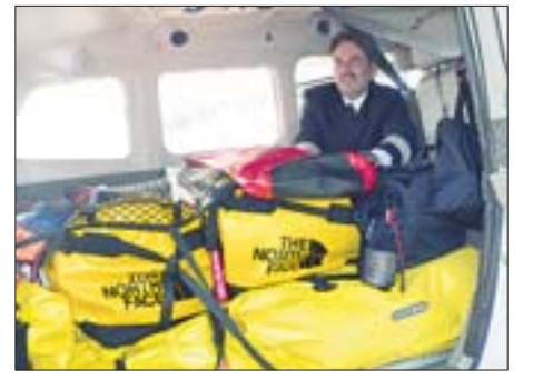
Gepackt: Die Ausrüstung im Frachtraum ist beschriftet und gesichert.

Die HAZ wird von heute an täglich mit den Piloten Kontakt haben – und Logbuch über ihre Erlebnisse führen.