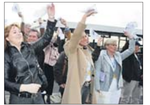
Gewunken: Freunde und Verwandte senden einen letzten Abschiedsgruß gen Himmel.